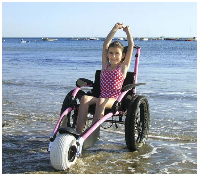
Hippocampe à Binic, Côtes d'Armor