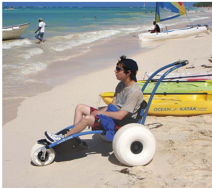
Hippocampe avec roues ballons sur une plage de Honolulu, Hawaiï