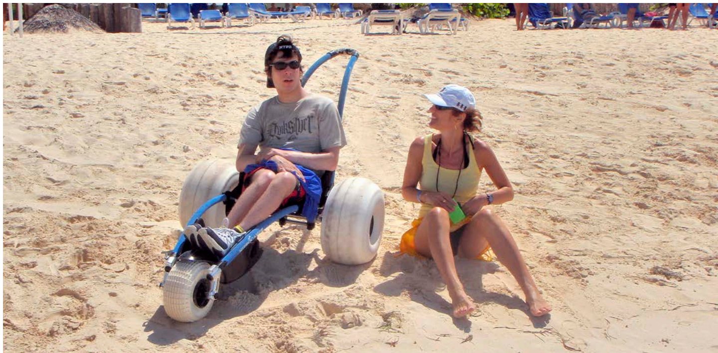
Hippocampe avec roues ballons (optionnelles) qui facilitent le déplacement sur la plage.

Il existe aussi différents accessoires optionnels pour plus de confort et praticité : freins de parking, accoudoirs, appui-tête, dossier réglable, harnais, ceinture ventrale, filet de protection, assise stabilo, paire de skis arrière, kit ski avant, roues ballons, sac de transport et sac dossier. Nous recommandons les roues ballons qui remplacent les roues doubles et facilitent la poussée du fauteuil sur sable fin pour un utilisateur adulte. L'utilisateur doit être accompagné s'il utilise le fauteuil avec les roues ballons.